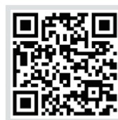
환자안전 주의경보 바로가기!