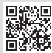
환자안전 보고학습시스템 바로가기!

* 환자안전 보고학습시스템(KOPS)에서는 유사 환자안전사고 보고 사례를 지속적으로 모니터링하며, 향후 추가적으로 관련 정보가 제공될 수 있음을 알려드립니다.