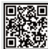
환자안전 주의경보 바로가기!