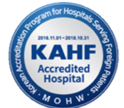
〈복지부 지정 마크〉

이와 더불어, 메디컬코리아 SNS 채널(페이스북, 웨이보, 브콘택테, Youtube 등)을 통해 지정 의료기관을 홍보하고, 외신 대상 취재 지원, 해외 홍보회 지원 등을 통해 적극적으로 지원할 계획입니다.