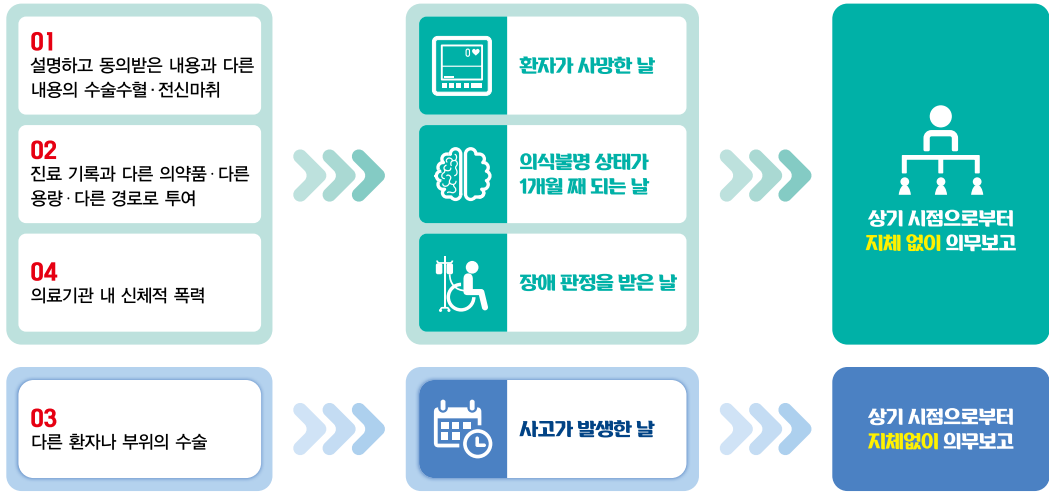
<그림. 의무보고 시기 판단기준 모식도>