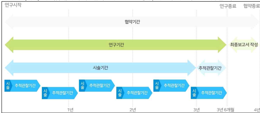
[예시] 시술(검사)의 추적관찰기간이 6개월인 경우, 제한적 의료기술 근거창출 기간