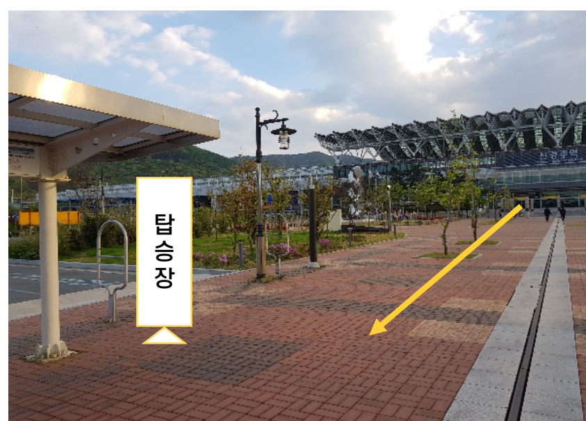
2 버스 전용 주차장에서 탑승