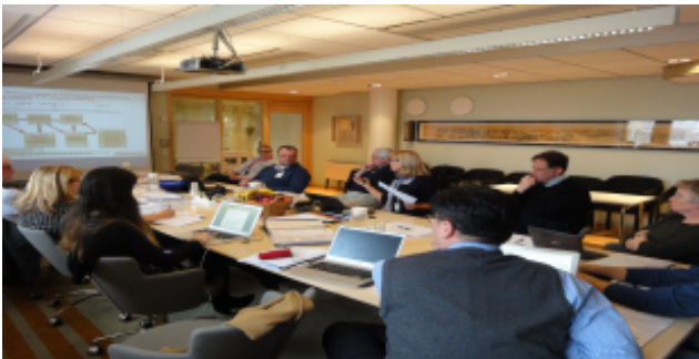
스웨덴 스톡홀름, 1st EuroScan Meeting