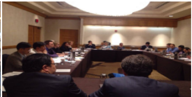
미국 워싱턴, 2nd EuroScan Meeting