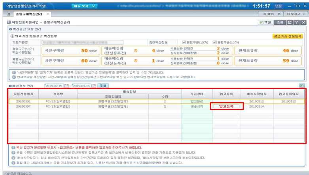
<그림 4. 배송내역 조회>