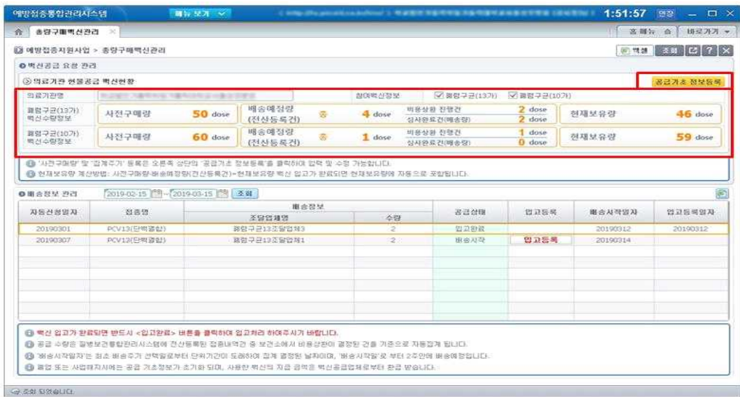
<그림 2. 총량구매 백신현황 조회>