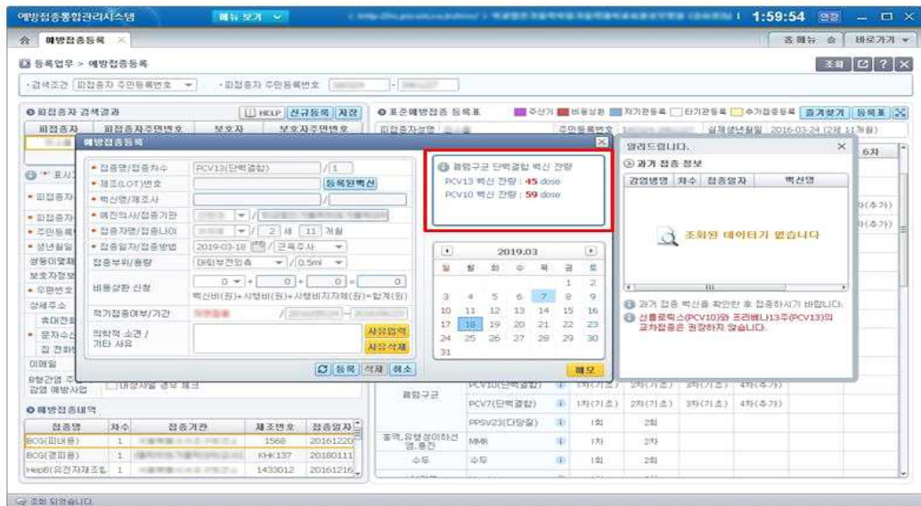
<그림 5. 예방접종등록 팝업 화면>