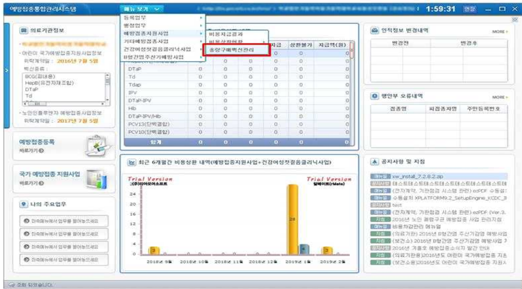
<그림 1. 총량구매 백신관리 메뉴>