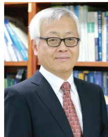
조문준 대한폐암학회 이사장