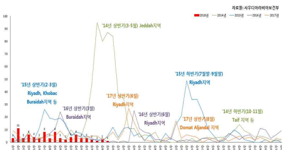
〈사우디 주별 발생 현황 ('14-'18.5.17.)〉

* 메르스 신고대상 방문 국가(지역): 바레인, 이라크, 이란, 이스라엘, 요르단, 쿠웨이트, 레바논, 오만, 카타르, 시리아, 사우디아라비아, 아랍에미리트, 예멘