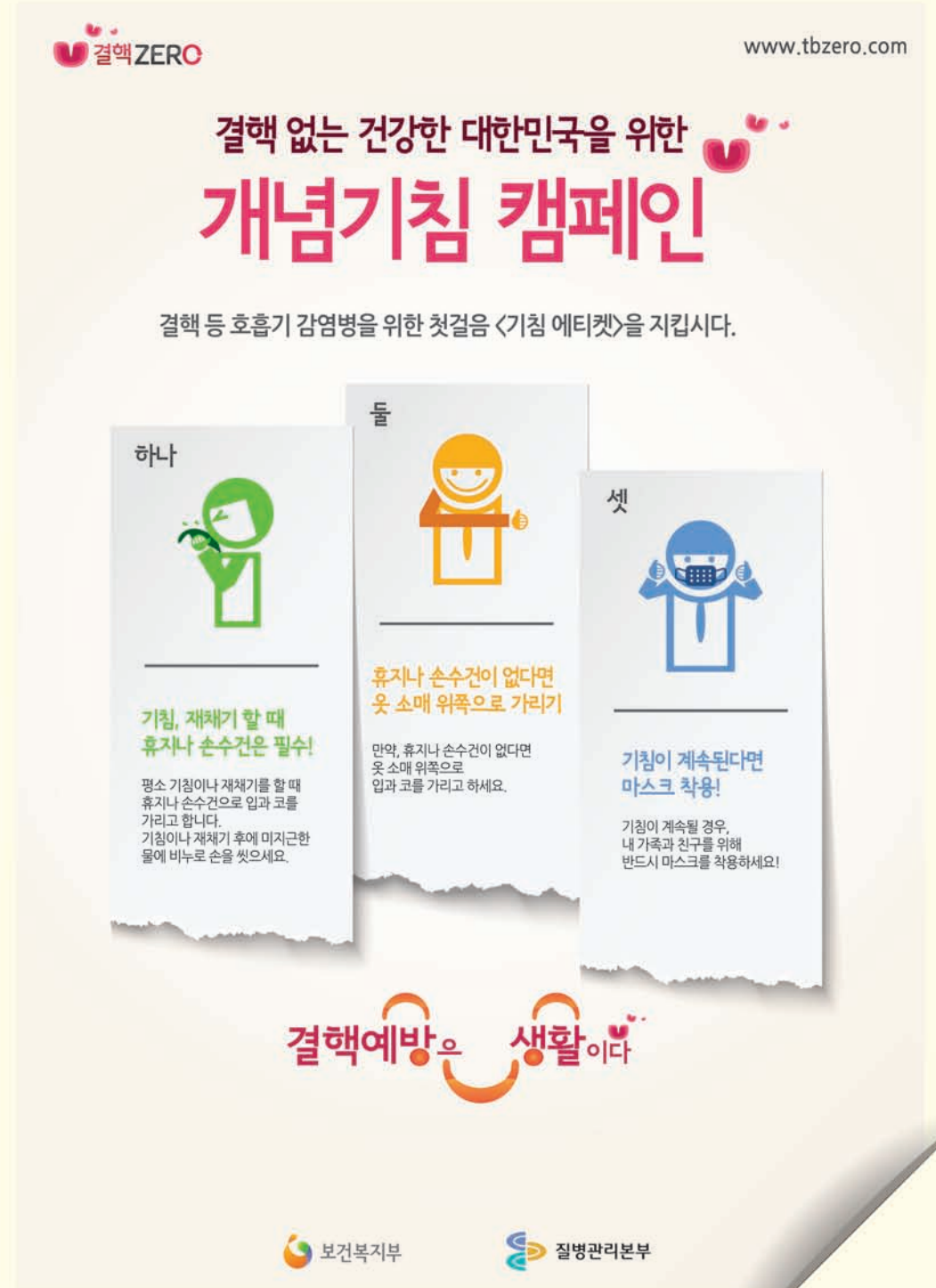
2013년 결핵예방 개념기침 캠페인 포스터